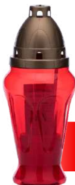
Lampion el. PAXDEI EL TI LED [18kom/karton] BC: 3858888025014