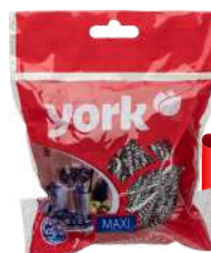
YORK žica za suđe MAXI 1/1 [10kom/karton] BC: 5903355000549