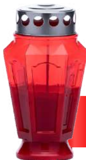
Lampion Piramida srednja 563037 visina 16,5 cm [18kom/karton] BC: 3859890563037