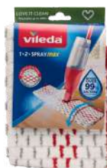
VILEDA 1.2 Spray Max mop [4kom/karton] BC: 4023103199217