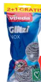
VILEDA inox spirala za ribanje 2+1 Glitzi [20kom/karton] BC: 4003790001970