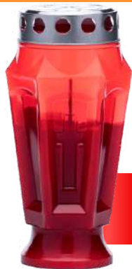
Lampion Piramida velika 560877 visina 20 cm [20kom/karton] BC: 3859890563877