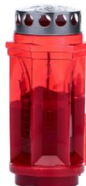
Lampion Kapelica 63440 visina 18 cm [20kom/karton] BC: 3859890563440