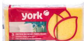
YORK Spužva za suđe 3/1 [42kom/karton] BC: 5903355000273