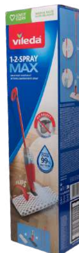
VILEDA 1.2 Spray Max BOX Set [1kom/karton] BC: 4023103222755