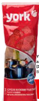
YORK plastična žica za suđe 3/1 - 133 [100kom/karton] BC: 5903355000334