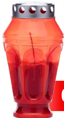
Lampion Maja velika 563228 visina 20,5 cm [12kom/karton] BC: 3859890563228