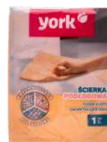
YORK krpa za pod 50x60 cm narančasta sintetička 083 [100kom/karton] BC: 5903355000105