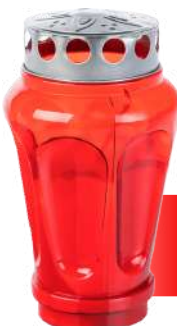
Lampion Maja srednja 563150 visina 17 cm [15kom/karton] BC: 3859890563150