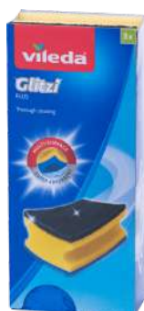
VILEDA spužva za suđe 3/1 Glitzi PLUS [42kom/karton] BC: 4003790001444