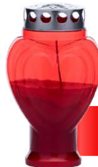
Lampion Srce 563327 visina 17,5 cm [15kom/karton] BC: 3859890563327