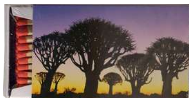
KM ŠIBICE 10 x 42/1 EUROPA [80kom/karton] BC: 4004753042603