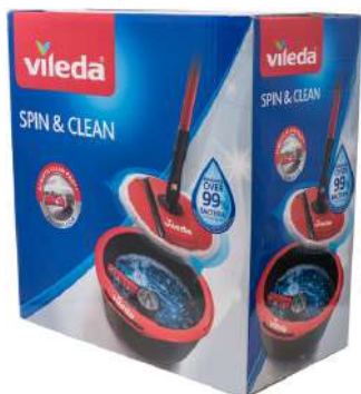
VILEDA Spin & Clean mop set [1kom/karton] BC: 4023103214293