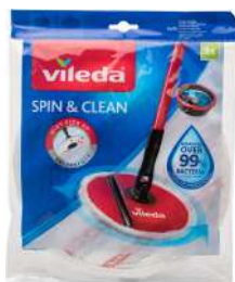
VILEDA Spin & Clean mop [8kom/karton] BC: 4023103214316