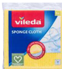
VILEDA TRULEX 5/1 spužvasta krpa za suđe [40kom/karton] BC: 8001940001432