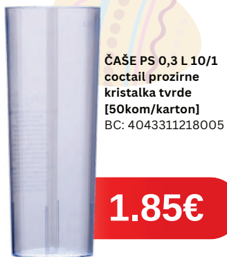
ČAŠE PS 0,3 L 10/1 cocktail prozirne kristalka tvrde [50kom/karton] BC: 4043311218005