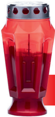
Lampion Piramida velika 560877 visina 20 cm [20kom/karton] BC: 3859890563877