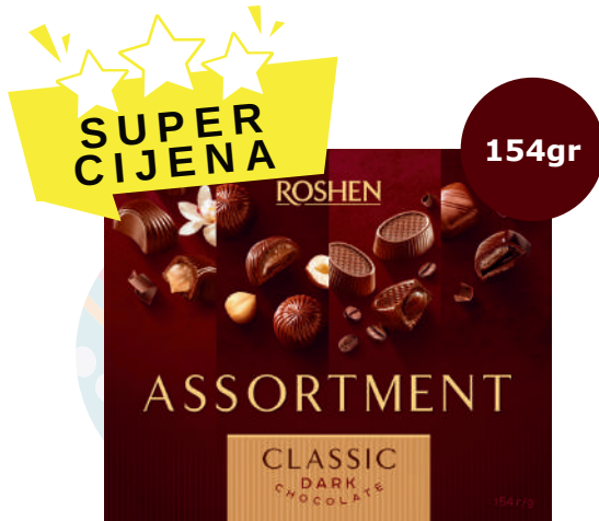
TAMNA ČOKOLADA 4823077611940