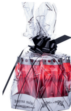
Lampion "Iskrena sućut" SET 5/1 [1kom/karton] BC: 3859890563174