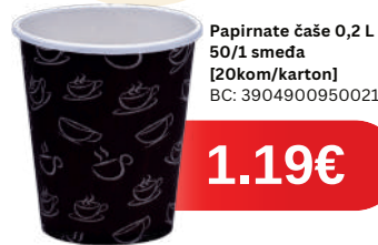
Papirnatе čaše 0,2 L 50/1 smeđa [20kom/karton] BC: 3904900950021