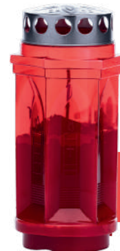
Lampion Kapelica 63440 visina 18 cm [20kom/karton] BC: 3859890563440