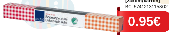
ABENA papir za pečenje 8 m x 38 cm [24kom/karton] BC: 5741213115802