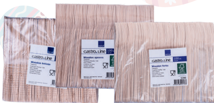
Drveni noževi 100/1 BC: 5703538457135 Drvene žlice 100/1 BC: 5703538457210 Drvene vilice 100/1 BC: 5703538457173 [20kom/karton]