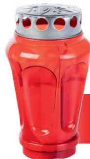
Lampion Maja srednja 563150 visina 17 cm [15kom/karton] BC: 3859890563150