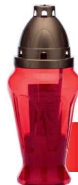
Lampion el. PAXDEI EL TI LED [18kom/karton] BC: 3858888025014