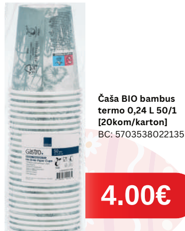
Čaša BIO bambus termo 0,24 L 50/1 [20kom/karton] BC: 5703538022135