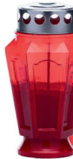
Lampion Piramida srednja 563037 visina 16,5 cm [18kom/karton] BC: 3859890563037