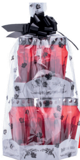
Lampion "Iskrena sućut" SET 8/1 [-kom/karton] BC: 3859890563693