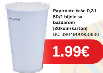
Papirnatе čaše 0,3 L 50/1 bijele sa baždaram [20kom/karton] BC: 3904900950830