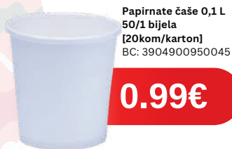
Papirnatе čaše 0,1 L 50/1 bijela [20kom/karton] BC: 3904900950045