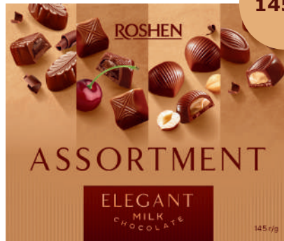
MLIJEČNA ČOKOLADA 4823077611933