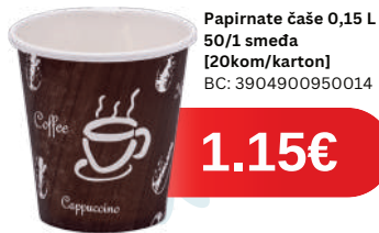
Papirnatе čaše 0,15 L 50/1 smeđa [20kom/karton] BC: 3904900950014