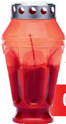
Lampion Maja velika 563228 visina 20,5 cm [12kom/karton] BC: 3859890563228