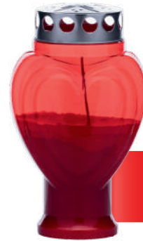
Lampion Srce 563327 visina 17,5 cm [15kom/karton] BC: 3859890563327