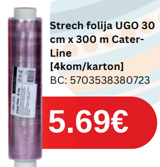
Strech folija UGO 30 cm x 300 m Cater- Line [4kom/karton] BC: 5703538380723